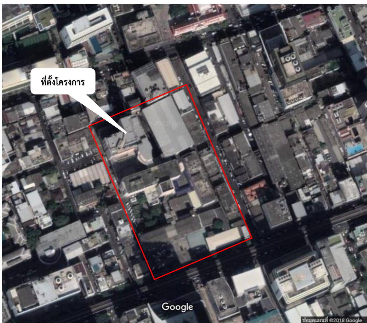
รูปภาพ 1-1 แผนที่โครงการ

8.3 ที่ตั้งโครงการ โรงพยาบาลกรุงเทพคริสเตียน ตั้งอยู่เลขที่ 124 ถนนสีลม แขวงสุริยวงค์ เขตบางรัก จังหวัดกรุงเทพมหานคร ก่อสร้างเมื่อปี พ.ศ.2478 จนถึงปัจจุบัน มีจำนวนเตียงผู้ป่วยค้างคืนทั้งหมด 244 เตียง ดังแสดงในรูปภาพ 1-1